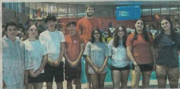
Le CNC était bien représenté à Saint-Nazaire. CNC

Cette compétition était réservée pour les juniors et plus. « Elle s'est déroulée dans une bonne ambiance