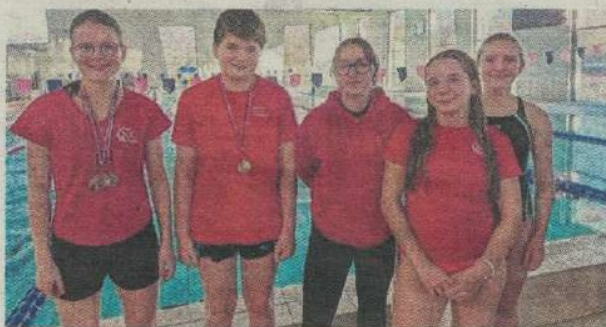
Le CNC a brillé du côté de Challans.-CNC

La compétition interdépartementale de Challans, en Vendée, a rassemblé 47 nageurs et nageuses, issus de sept clubs des Pays de la Loire. Le CNC (Club-nautique castelbriantais) était représenté par quatre nageurs de la catégorie benjamins, « qui ont livré une très belle prestation d'ensemble en remportant cinq médailles », souligne le club.