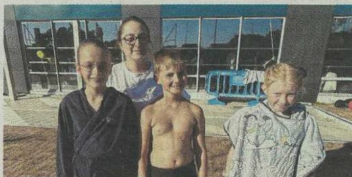
Les jeunes du CNC ont pris part à plusieurs compétitions en octobre. CNC

Le mois d'octobre a été riche en compétitions pour les nageurs du Club-nautique castelbriantais (CNC). Après leur participation au meeting de l'AquaChoisel, les jeunes nageurs du CNC ont retrouvé les compétitions départementales.