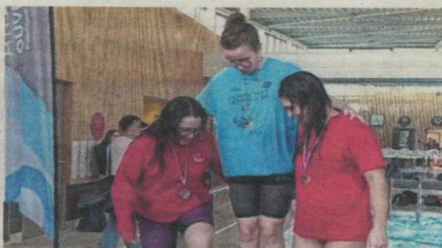
Les nageurs du CNC ont décroché plusieurs podiums à Blain. CNC

Les nageurs du Club-nautique castelbriantais (CNC) ont participé au meeting de Blain le 30 novembre. « Une bonne cohésion de groupe se met en place au fil des compétitions et à travers les différents niveaux. Il est important de continuer dans cette dynamique. Les nageurs montrent une réelle envie de progresser et écoutent attentivement les conseils techniques, ce qui leur permet de s'améliorer rapidement », résume le club à l'issue de la compétition.