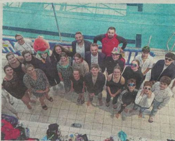
Les nageurs du CNC ont brillé. CNC

« Cette année, l'équipe féminine améliore son total de points par rapport à