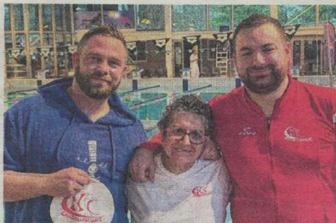
Le CNC a décroché plusieurs podiums à Château-Gontier. CNC

Dimanche 8 février, la piscine de Château-Gontier accueillait les championnats régionaux Masters, réunissant 139 nageurs issus de 26 clubs des Pays de la Loire, de Bretagne et d'Île-de-France. Une compétition réservée aux nageurs et nageuses âgés de plus de 25 ans.