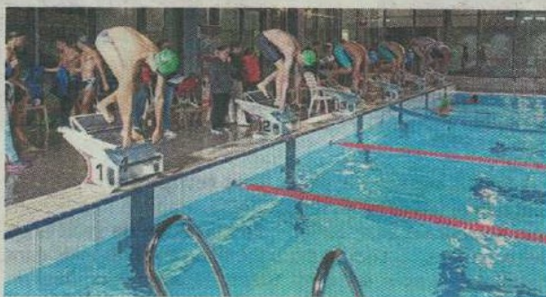
Le meeting a été « une réussite ». CNC

Les dirigeants du CNC pouvaient être satisfaits, au terme de cette soirée du 27 septembre. Huit clubs étaient présents : Château-Gontier, Saint-Sébastien, ASPTT Nantes, Carquefou, Nort-sur-Erdre, Ancenis, Pornic et le CNC. « Au total, 103 nageurs ont participé à cette rencontre, représentant 279 engage-