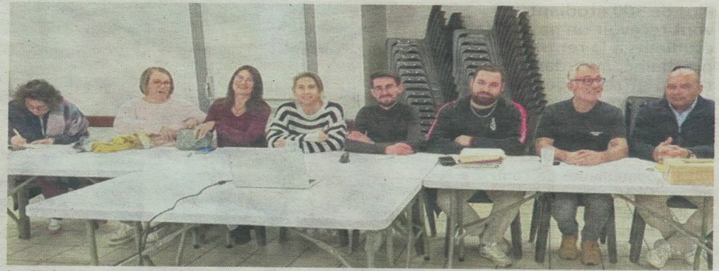
Le CNC a tenu son assemblée générale. CNC

L'un des enjeux majeurs de cette assemblée fut le renouvellement du bureau, marqué