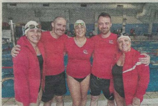
Le CNC a brillé au meeting des maîtres de Carquefou.-CNC

Mi-décembre, l'AS Carquefou a organisé son quatrième meeting des Maîtres, une compétition réservée aux nageurs de plus de 25 ans. Au total, 207 participants, issus de 26 clubs des Pays de la Loire, de la Nouvelle-Aquitaine, de l'Île-de-France et du Centre-Val de Loire, étaient présents.