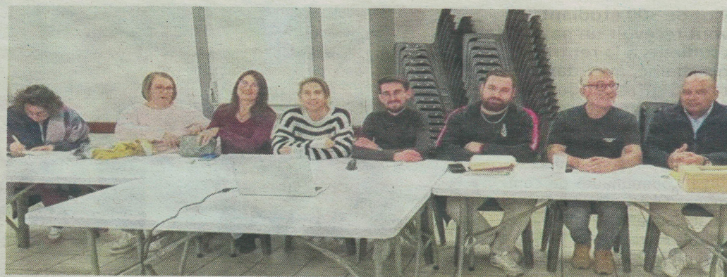
Le CNC a tenu son assemblée générale. CNC

L'un des enjeux majeurs de cette assemblée fut le renouvellement du bureau, marqué