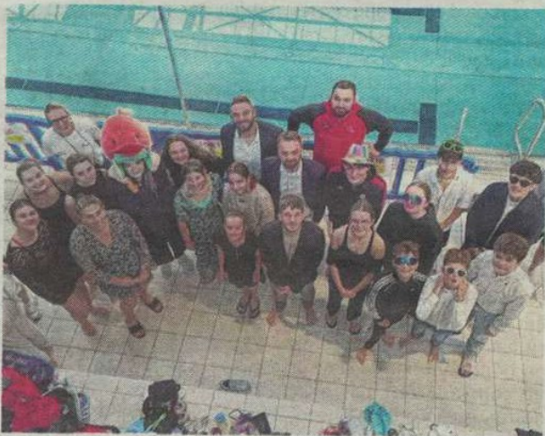
Les nageurs du CNC ont brillé. CNC

« Cette année, l'équipe féminine améliore son total de points par rapport à