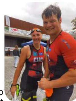
Swimrun Redon duo Médaille d'argent