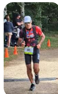
Tri breizh L