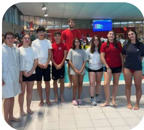
Meeting du SNAN