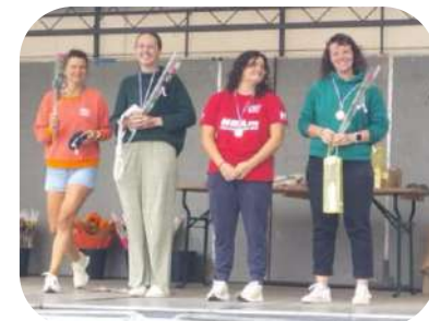
6km NL Redon