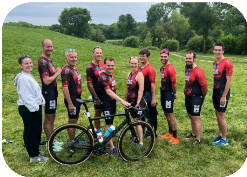
Triathlon de Vertou

Le CNC au complet lors du triathlon de Vertou