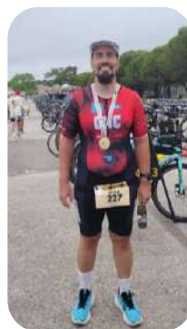
IronMan Frenchman Landes