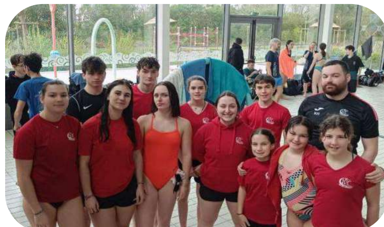
Coupe de Blain