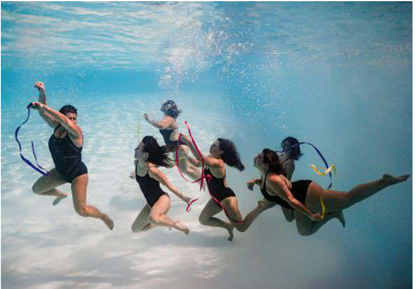
Groupe « masters » natation artistique

Natation Artistique – Natation Sportive – Triathlon