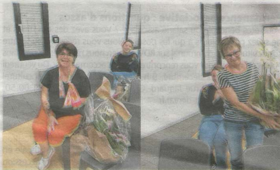
Le bureau du CNC a été modifié lors de l'assemblée générale.