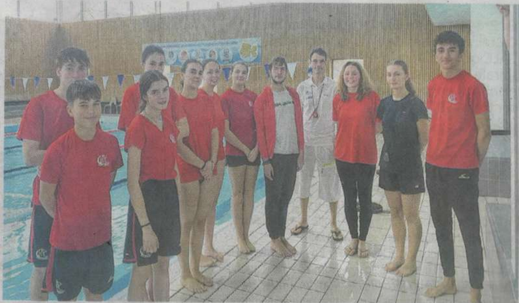
Les nageurs du Club-nautique castelbriantais (CNC) ont empoché huit médailles, lors de la Coupe de Blain.