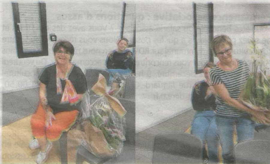
Le bureau du CNC a été modifié lors de l'assemblée générale.