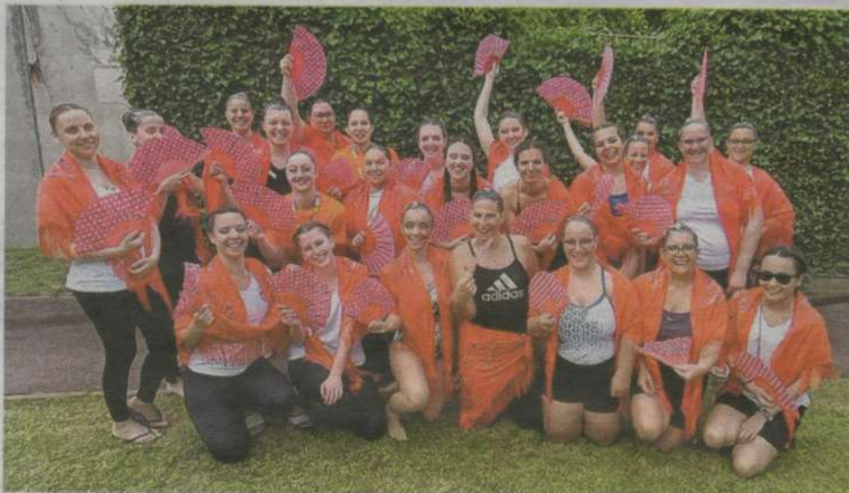
Le Club nautique castelbriantais a brillé au tournoi international de Paris. Club nautique castelbriantais

Cette compétition a aussi permis aux nageuses de participer à un ballet multi, une catégorie de ballet qui n'existe qu'au tournoi international de Paris. Il