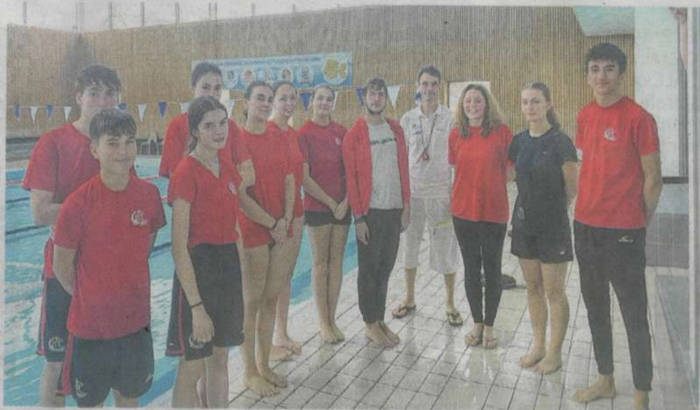
Les nageurs du Club-nautique castelbriantais (CNC) ont empoché huit médailles, lors de la Coupe de Blain.