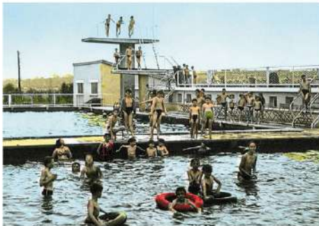
Les nageurs s'entraînent dans la piscine en plein air route de Vitré, construite en 1953.