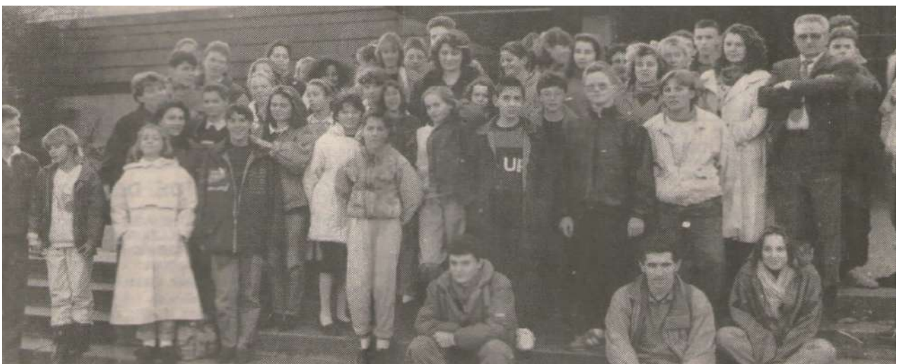
Séjour du CNC à Radevormwald du 29 octobre au 1er novembre 1988

Le CNC est ensuite retourné à Radevormwald du 29 octobre au 1er novembre 1988 avec 48 nageurs et 6 accompagnateurs.