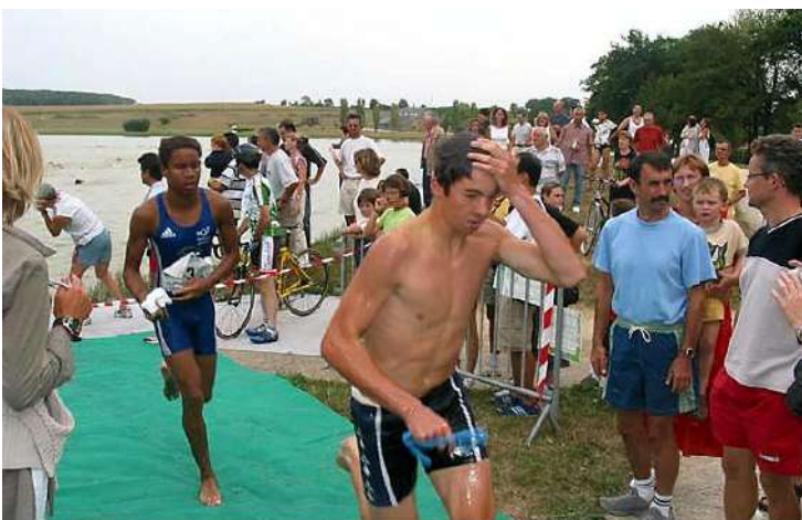
2003 - Sortie de l'eau sur le site de Choisel

Le CNC a organisé 6 triathlons à Châteaubriant entre 2003 et 2008.