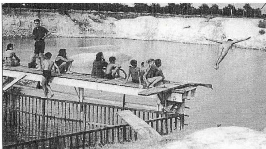
De 1940 à 1953, le CNC s'entraînait dans une piscine aménagée dans la Carrière des Princes. Elle était située aux Cohardières, route de Juigné, près de l'ancien hippodrome.