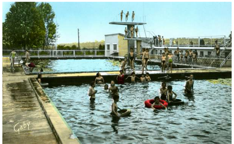
La piscine en « plein air » route de Vitré

Pendant la saison hivernale, le dimanche matin, les nageurs effectuaient des séances de musculation dans la salle « cité Carfort ». De temps en temps, un entraînement était programmé à la piscine des Baumettes à Angers ou à la piscine Saint Georges à Rennes.