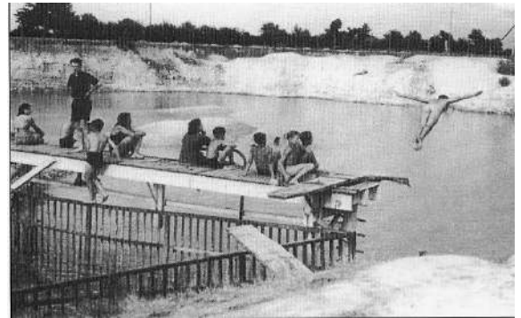
La carrière des Princes - 1943

L'origine du CNC s'est quelque peu perdue dans les profondeurs d'une carrière remplie d'eau. En effet, de 1940 à 1953, le CNC s'entraînait dans une piscine aménagée dans la « Carrière des Princes ». Cette dernière était située aux Cohardières, route de Juigné, près de l'ancien hippodrome. Elle comportait un espace limité destiné aux débutants qui souhaitaient apprendre à nager. Tous les ans, le CNC organisait une grande fête nautique qui rassemblait de nombreux Castelbriantais.