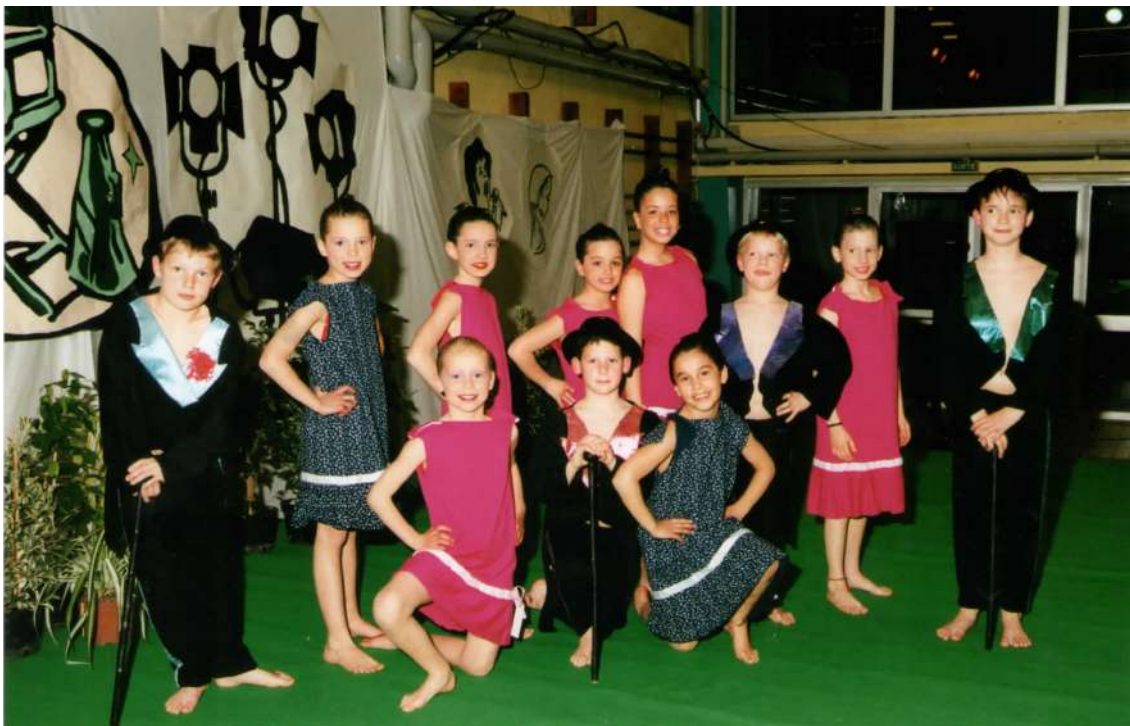
Groupe « sauv'nage » lors du gala de natation artistique en 2003

Après obtention de ce premier test, les nageurs doivent faire un choix entre les 2 spécialités : la natation artistique ou la natation de course.