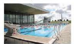
Aqua Choiseil.

Limités dans un premier temps, les créneaux d'entraînement devraient être plus nombreux au fil des semaines. « Avec l'allongement du couvre-feu, on va pouvoir de nouveau proposer des horaires le soir jusqu'à 20 h 30, 21 h. » Si une telle chose est