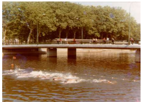
Départ de la traversée de Laval (1970)

Suite à des problèmes de pollution, les compétitions en eau libre ont été suspendues.