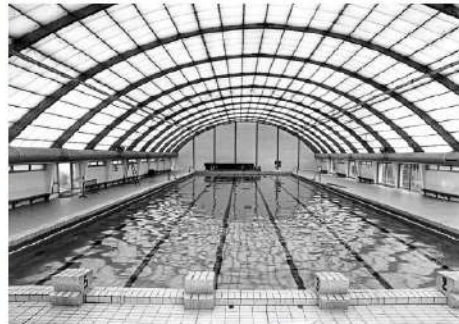
Après la piscine Leo-Lagrange de Nantes, le CNC fut le deuxième club à disposer, en 1969, d'un bassin de 50 m couvert appelé piscine olympique.