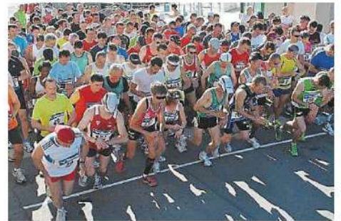
Le 8 juillet 2005, la section triathlon du Club nautique organisait, avec le soutien de la Communauté de Communes, la première course à pied sur la voie verte.