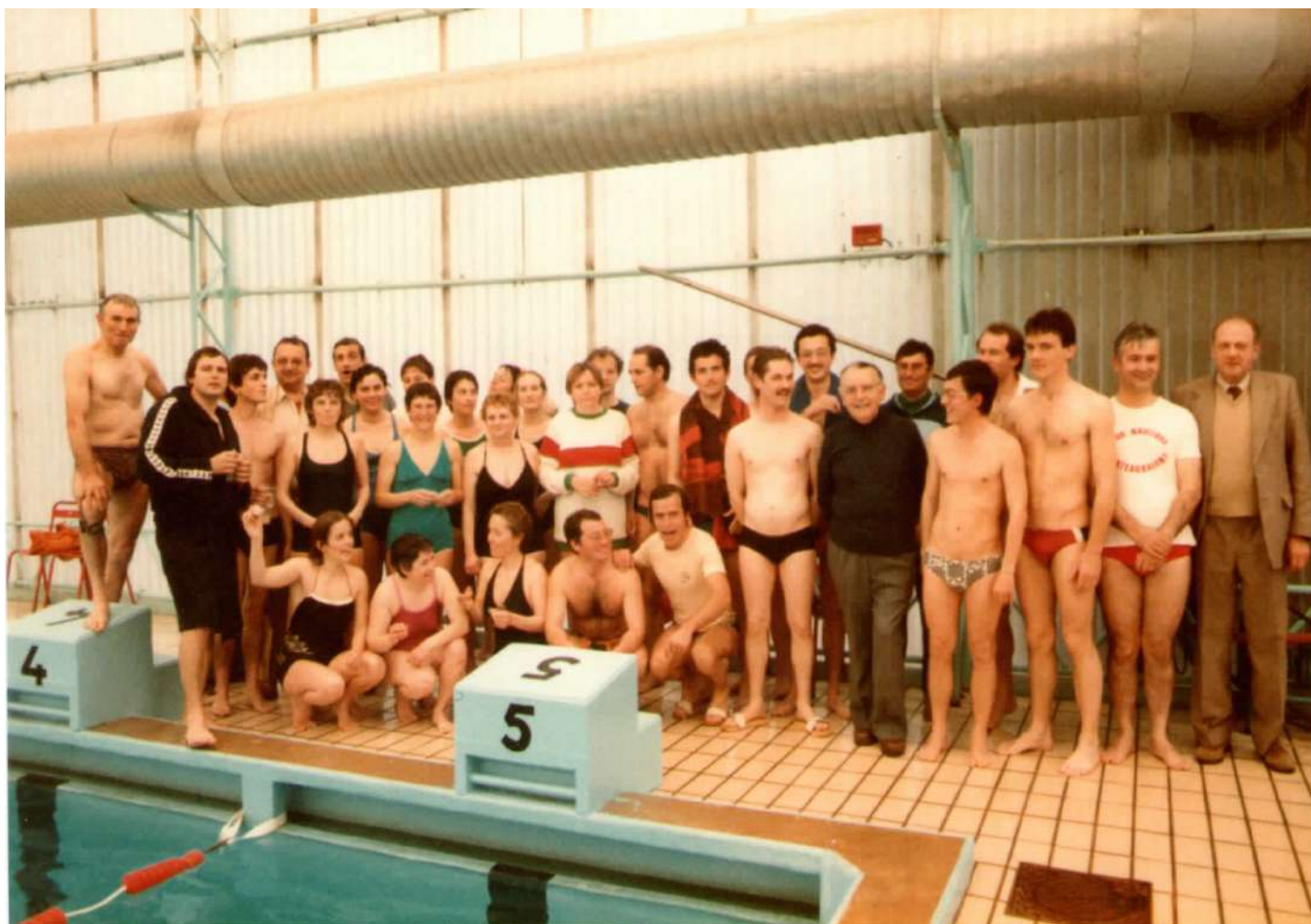
Piscine route de Vitré - 20ème anniversaire du CNC Compétition amicale avec les anciens nageurs, éducateurs et dirigeants du club