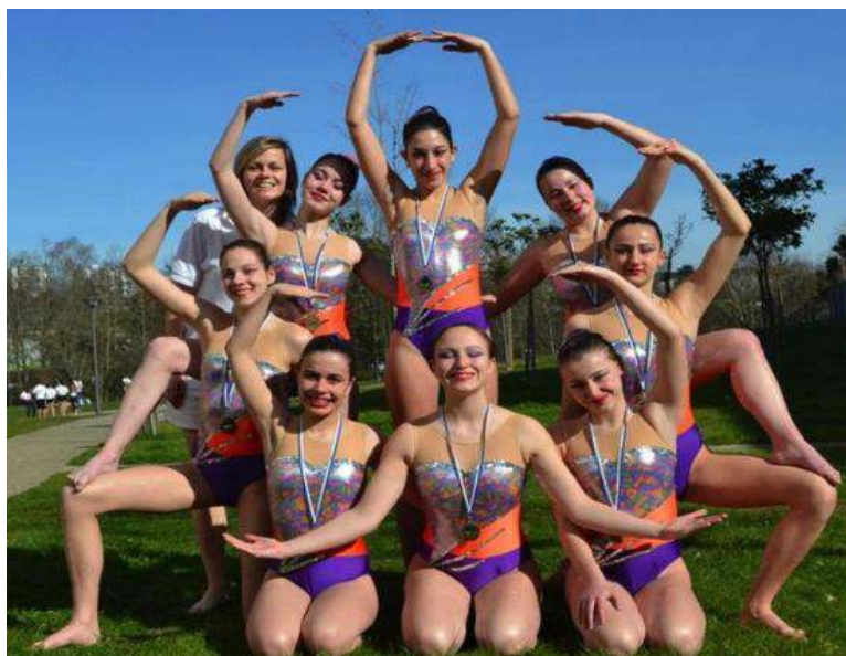
Natation artistique 2014/2015