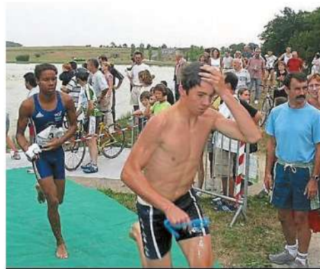
Le CNC a organisé six triathlons à Châteaubriant, entre 2003 et 2008.