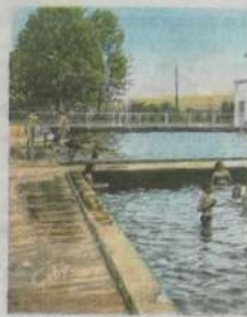
En 1953, une piscine de plein air construite route de Vitré.